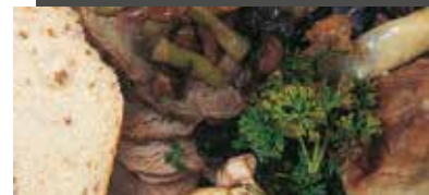
Øvrigt herunder madaffald, tekstiler m.v.