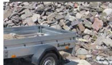
Bygge- og anlægsaffald